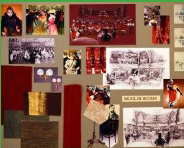
(Moodboard do filme Moulin Rouge , 2001. Por Anne Seibel)