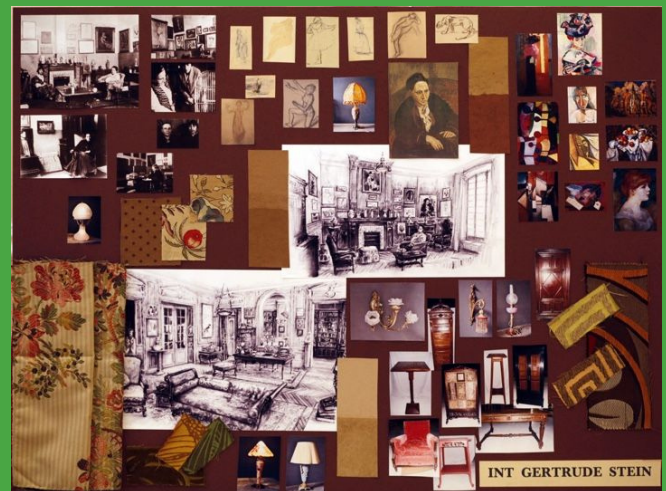
(Moodboard do filme Meia noite em Paris , 2011. Por Anne Seibel)